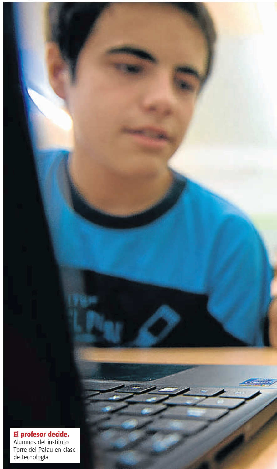
El profesor decide. Alumnos del instituto Torre del Palau en clase de tecnología

Pero donde unos ven problemas, otros ven oportunidades, y sobre todo, la necesidad de formación. "Se educa en el uso no en la prohibición. Podemos decirles que no traigan el móvil, pero en la calle lo van a seguir utilizan-