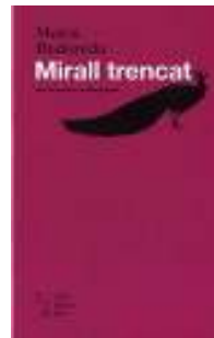
Mirall Trencat Mercè Rodoreda Grup Editor ISBN 978-84-732-9224-5