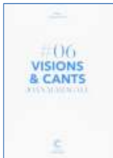
Visions i Cants Joan Maragall Clàssics Castellnou, n° 6 ISBN 978-84-174-0613-4