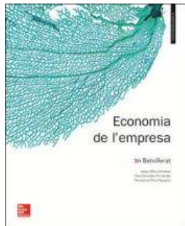
Economia de l'empresa 2 Ed.Mc Graw-Hill ISBN 978-84-486-1450-8