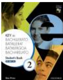
Oxford Key 2n batx Ed. Oxford - Student's Book (no reciclable) ISBN 978-01-946-1119-0

- Workbook (no reciclable) ISBN 978-01-946-1122-0