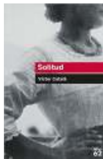
Solitud Víctor Català Educaula. Educació 62, n° 8 ISBN 978-84-926-7238-7