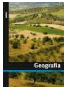
Geografia Ed.Edebé ISBN 978-84-236-9525-6

Es treballarà amb dossier. Si els alumnes volen un llibre de consulta es recomana: