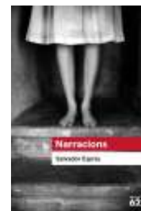
Narracions Salvador Espriu Educaula, Ed. 62, n° 79 ISBN 978-84-151-9254-1