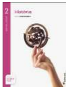
Història 2 Batxillerat Grup Promotor Sanfillana ISBN 978-84-913-0280-3 (RECOMANAT)

Si els alumnes volen un llibre de consulta es recomana comprar-ne aquest