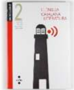
Llengua catalana i literatura 2 Batxillerat Ed. Cruïlla. Edició revisada 2013 ISBN 978-84-661-3280-0