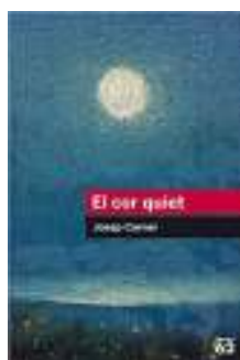
El Cor Quiet Josep Carner Educaula. Ed. 62 ISBN 978-84-159-5443-9