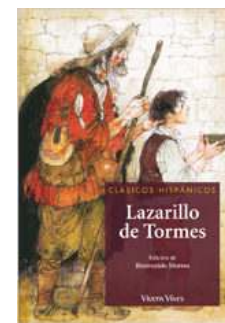
Lazarillo de Tormes Ed. Vicens Vives Clásicos Hispánicos, nº 4 ISBN 978-84-316-9981-9