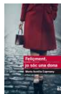
Felçment jo sóc una dona Maria Aurèlia Capmany Educaula. Ed. 62 ISBN 978-84-159-5444-6