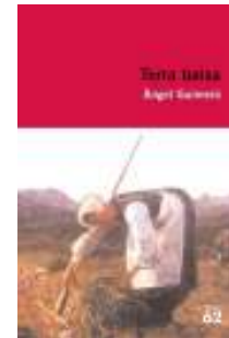
Terra Baixa Àngel Guimerà Educaula. Col. Educació 62 ISBN 978-84-926-7287-5